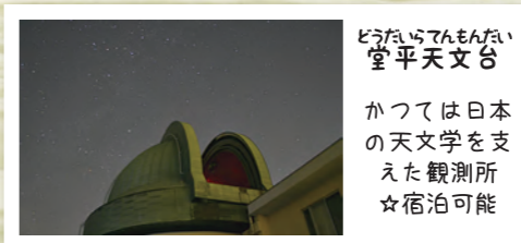
どうだいぜんもんじ 堂平天文台