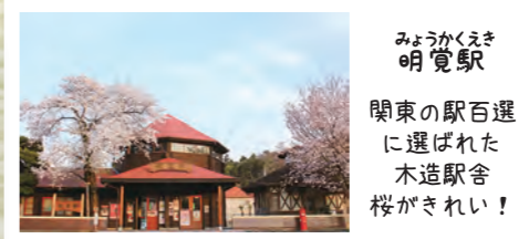
みょうかくえき 明覚駅